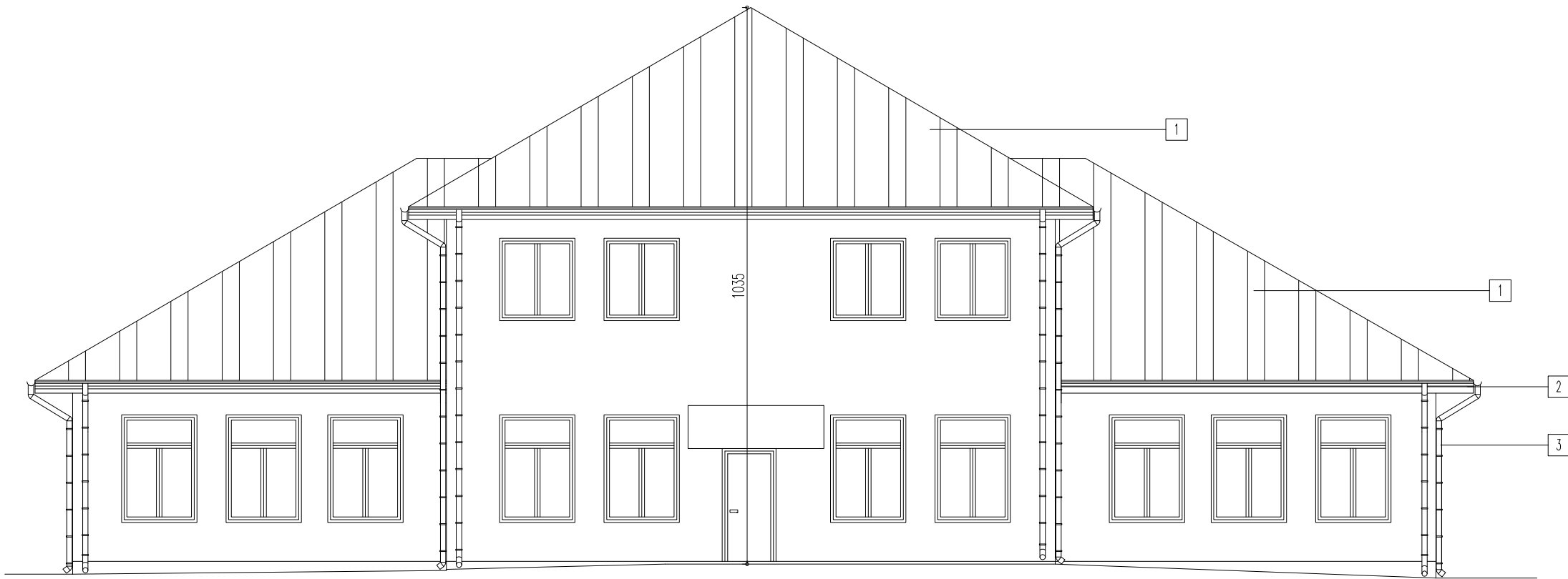
ELEWACJA FRONTOWA - POŁUDNIOWO - ZACHODNIA