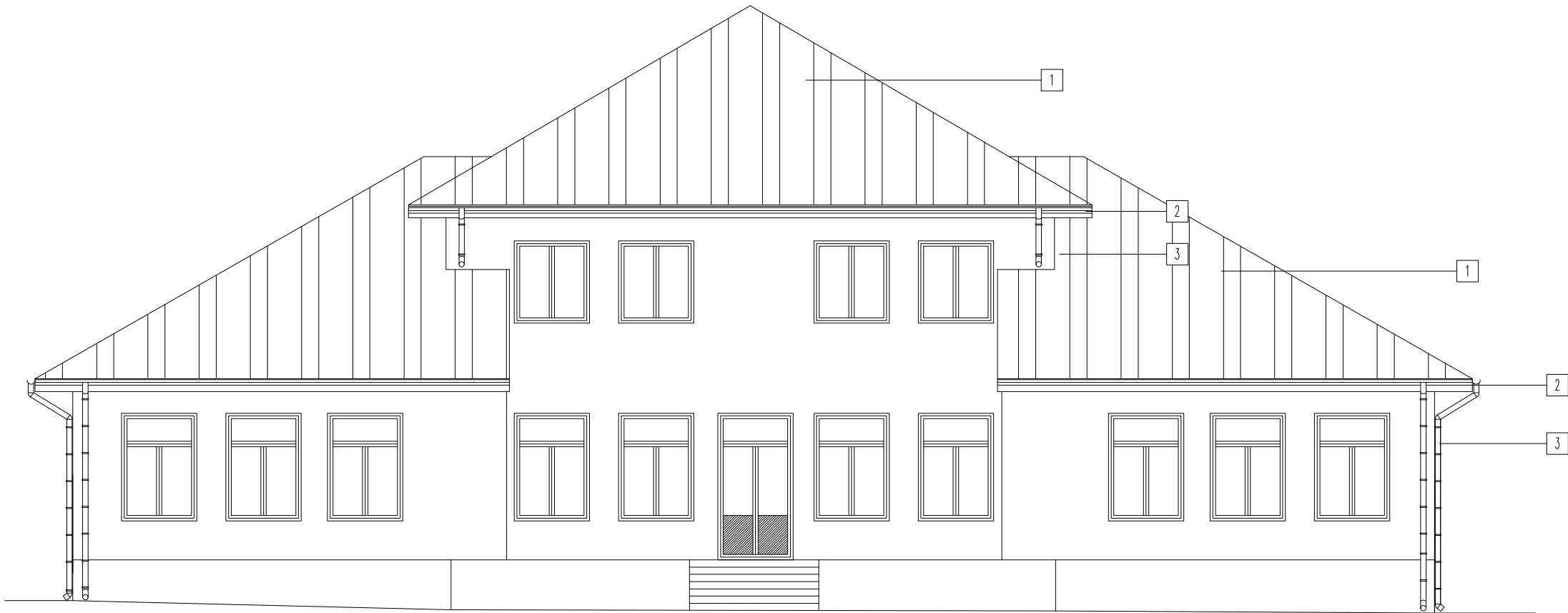
ELEWACJA TYLNA - PÓŁNOCNO - WSCHODNIA